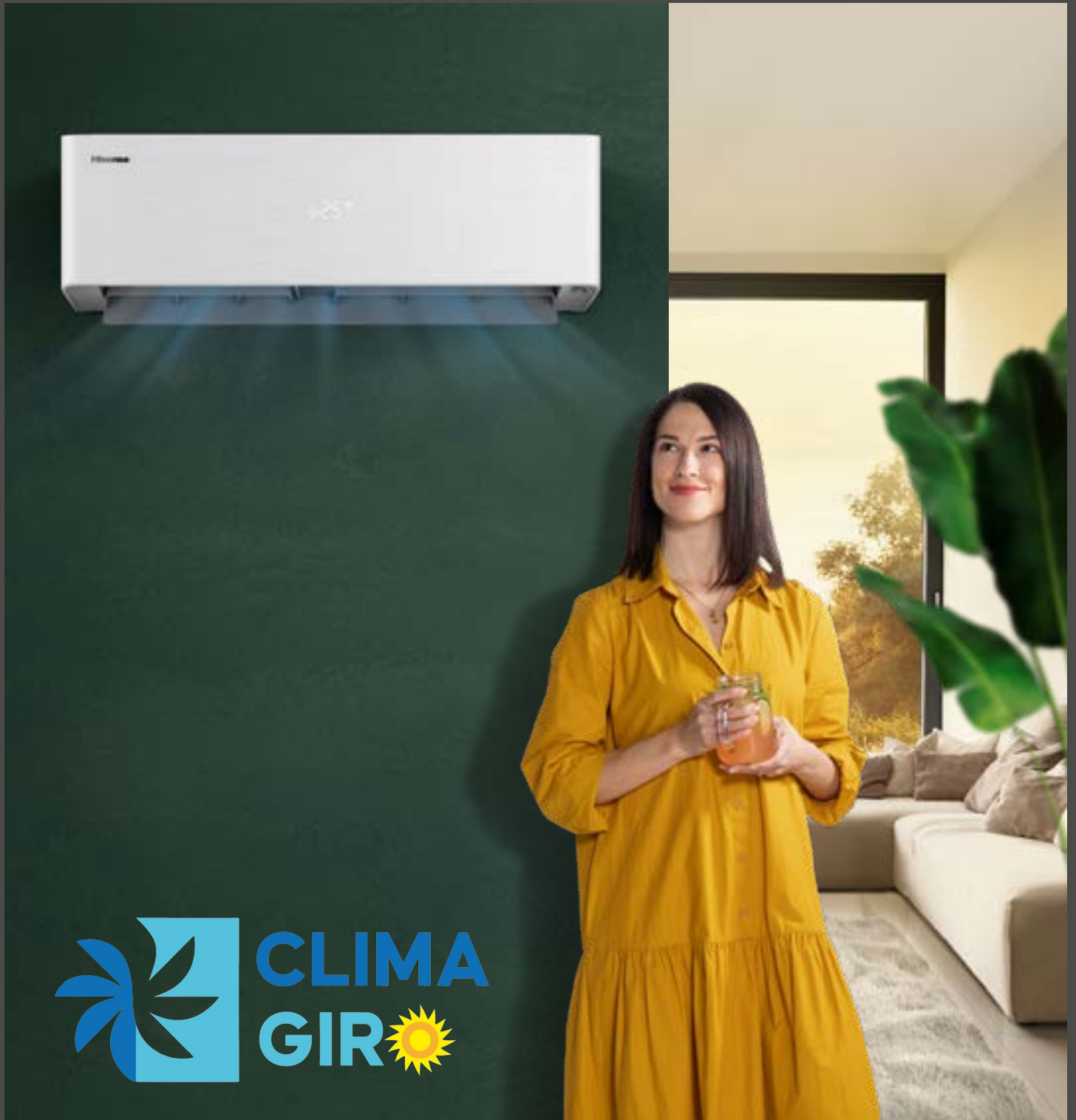
Tabela de Preços Ar Condicionado 2024